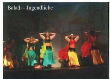
Baladi - Jugendliche