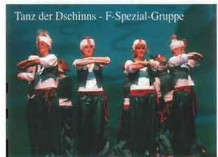
Tanz der Dschinnn - F-Spezial-Gruppe