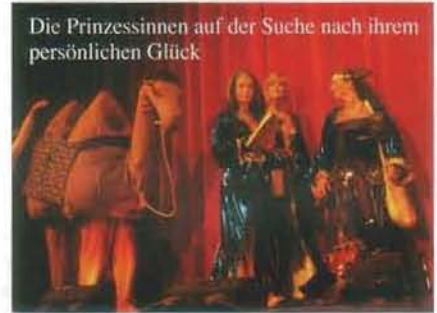
Die Prinzessinnen auf der Suche nach ihrem persönlichen Glück