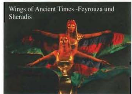
Wings of Ancient Times - Feyrouza und Shehradis