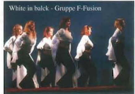
White in black - Gruppe F-Fusion